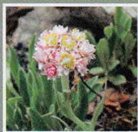
タカネヤハズハハコ