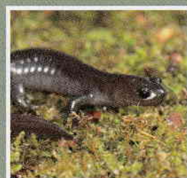
アカイシサンショウウオ