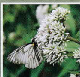
ミヤマシロチョウ ☆