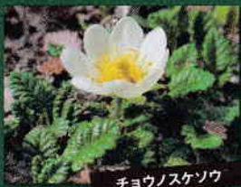
チョウノスゼソウ