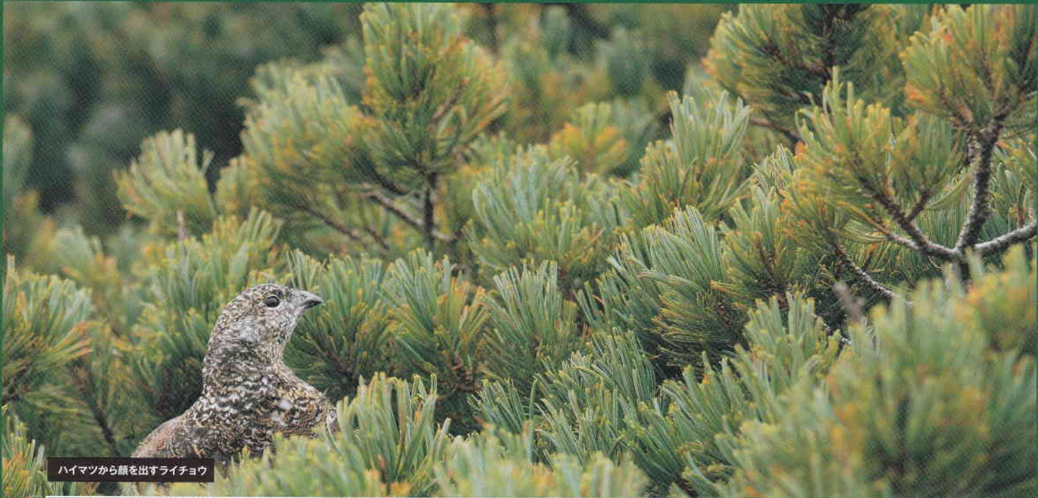
ハイマツから顔を出すライチョウ