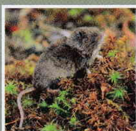
アズミトガリネズミ ☆