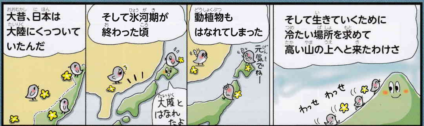
イラスト:「南アルプスの大自然 豊かな生命のみなもと」より

ライチョウは北半球の寒い地域に広く分布していました。 日本が大陸と陸続きだった氷河期に北の方から日本へやってきました。 そして、氷河期が終わり、地球が暖かくなると、 氷河期に日本へやってきたライチョウは、生きていくために寒い場所を求め、 高い山の上へと生息場所を移し、南アルプスの高山帯にたどり着きました。 氷河期から南アルプスに生息しているライチョウはとても貴重な動物で、 “氷河期の遺存種(いそんしゅ)”と呼ばれています。