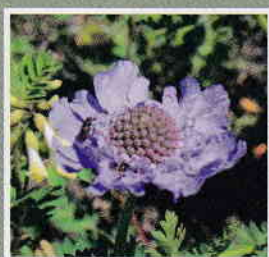
タカネマツムシソウ