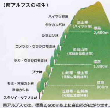
〈南アルプスの植生〉

本州中部の標高2,200m以上のハイマツと呼ばれる植物や岩石が多く存在する場所に住んでいます。山頂が雪で覆われる11月頃からは、少し標高が低い、ダケカンバが生える林で群れをつくり、生活します。