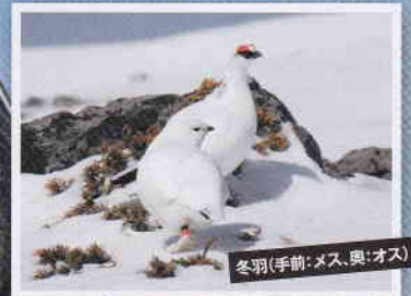
冬羽(手前:メス、奥:オス)