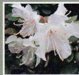
ハクサンシャクナゲ