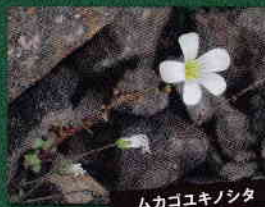
ムカゴユキノシタ